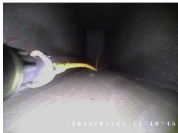
La camera arrière facilite et sécurise le retour du robot.