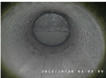
Photos d'une gaine ronde encrassée de 300mm de diamètre

*En raison de recherche et développements continus, les spécifications techniques, la conception ou l'apparence des produits peuvent différer.