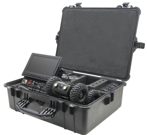
Une valise solide et étanche pour protéger le matériel des transports quotidiens et difficiles